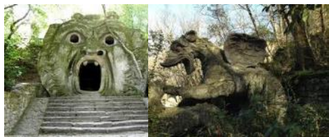
Figure in pietra raffiguranti miti e leggende nel "Parco dei Mostri di Bomarzo".

"La nascita di Venere" del Botticelli, opera che tutt'ora ispira i poeti e gli artisti di tutto il mondo e Fonte di sentimenti contrastanti che spesso sfociano in stati d'ansia e turbamento, sintomi conosciuti come Sindrome di Stendhal.